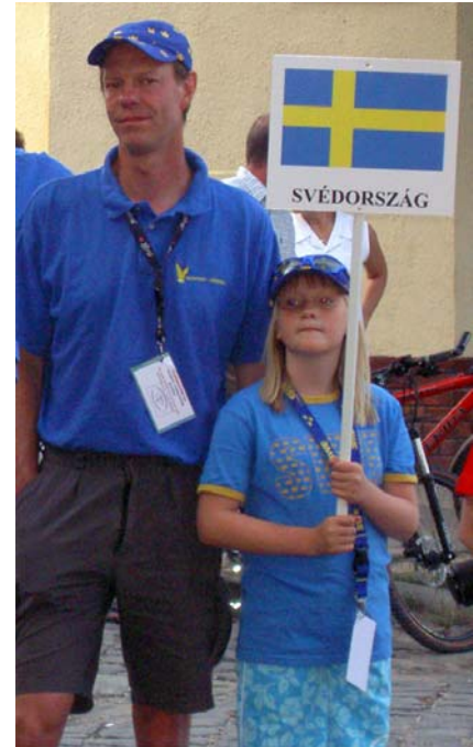
Per hade familjen med sig. Yngsta dottern var "fanbärare".